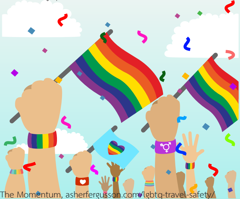
ที่มา: The Momentum, asherfergusson.com/lgbtq-travel-safety/

ความหลากหลายทางเพศอย่างครอบคลุม ส่วนประเทศที่อันตรายที่สุดในระดับ F มีอยู่กว่า 44 ประเทศ อันดับต้นๆ เป็นประเทศที่ใช้กฎหมายชาโรราะห์ (ประมวลกฎหมายที่มาจากคำสอนและหลักนิติศาสตร์พื้นฐานของศาสนาอิสลาม ครอบคลุมการดำเนินชีวิตของประชาชน การเมืองการปกครอง เศรษฐกิจ ไปจนถึงความสัมพันธ์ในครอบครัว) เช่น ไนจีเรีย กาตาร์ เยเมน ซาอุดีอาระเบีย แทนซาเนีย ซึ่งคนรักเพศเดียวกันในประเทศเหล่านี้มีโทษสูงถึงขั้นประหารชีวิต