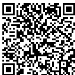
รายละเอียดผลการดำเนินการ