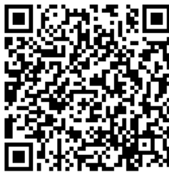
รายละเอียดผลการดำเนินการ