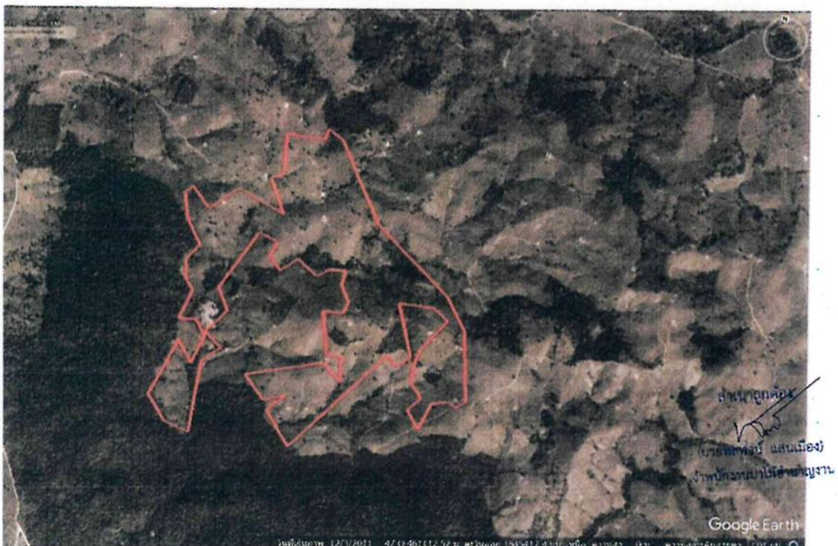
ภาพที่ ๒ แผนที่ภาพถ่ายทางอากาศ ปี ๒๕๕๔ แสดงสภาพพื้นที่ที่ถูกบุกรุกแผ้วถางใหม่และขยายพื้นที่ออกไปจากเดิม