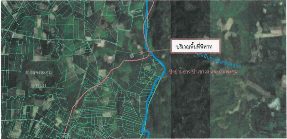
ภาพที่ ๖ เส้นสีแดงแสดงแนวเขตป่าสงวนแห่งชาติป่าย่านยาวฯ ที่ประกาศเมื่อปี ๒๕๒๑