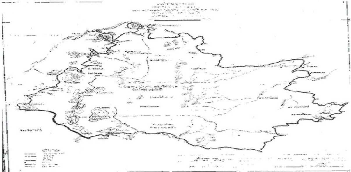
ภาพที่ ๕ แสดงแผนที่แนบท้ายกฎกระทรวง ฉบับที่ ๘๐๗ (พ.ศ. ๒๕๒๑) ออกตามความในพระราชบัญญัติป่าสงวนแห่งชาติ พ.ศ. ๒๕๐๗ ประกาศให้ป่าย่านยาวฯ เป็นป่าสงวนแห่งชาติ