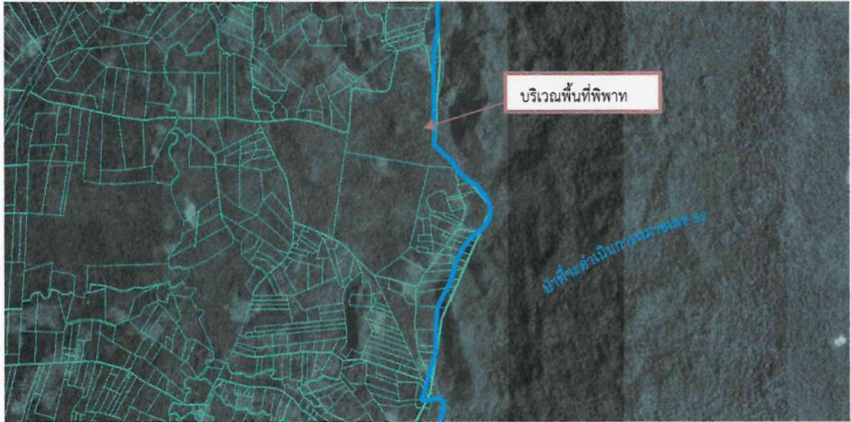
ภาพที่ ๔ แสดงข้อมูลที่ดินพิพาทและแนวเขตนิคมสหกรณ์พนมมาซ้อนทับกับภาพถ่ายทางอากาศ VAP-61 ที่ถ่ายระหว่าง พ.ศ. ๒๕๐๙ - ๒๕๑๓ พบว่า บริเวณที่ดินพิพาทมีร่องรอยการทำประโยชน์