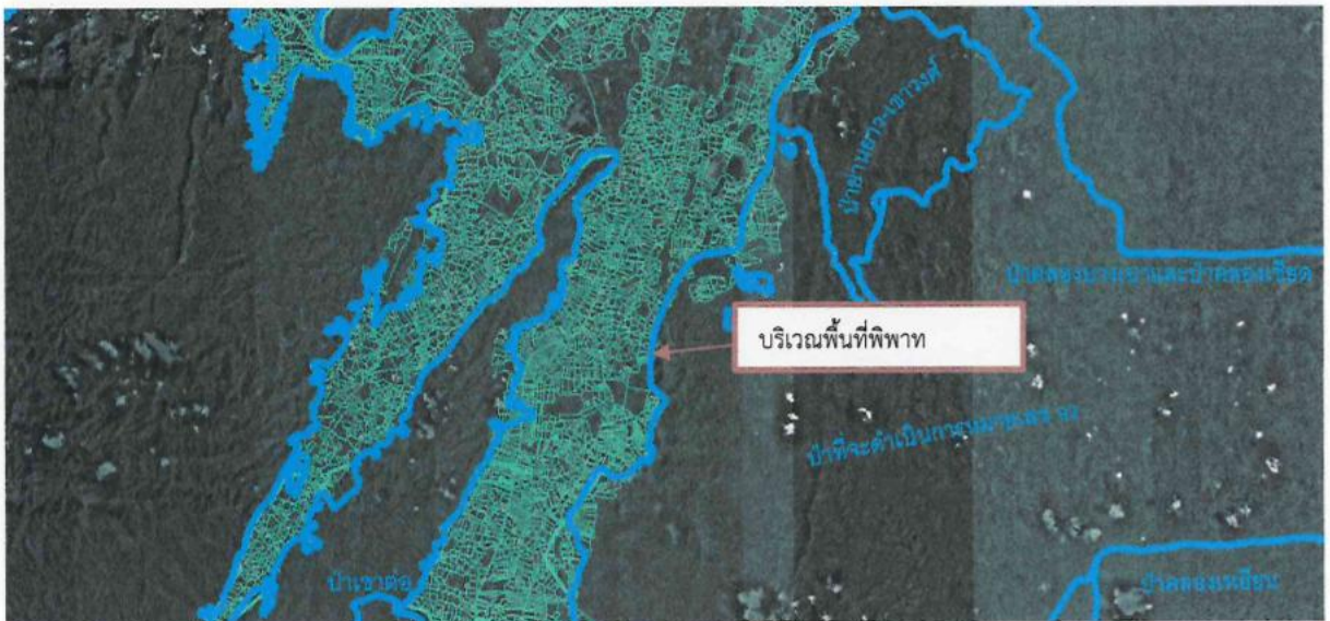
ภาพที่ ๓ แสดงแนวเขตนิกมสทกรมพนมเมื่อนำมาซ้อนทับกับแนวเขตป่าไม้ถาวร ชื่อ “ป่าเขาพนม-ป่าพลูเถื่อน” พบว่า แนวเขตซ้อนทับกันเกือบทั้งหมด จึงอาจตีความได้ว่านิกมสทกรม ได้ใช้แนวเขตป่าไม้ถาวรในการจัดทำแนวเขต