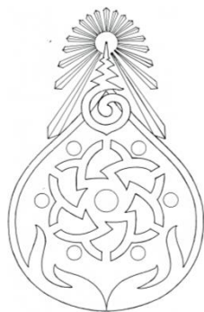
แบบเครื่องหมายสำหรับติดทับบนอินทธรณู ทำด้วยโลหะสีทอง