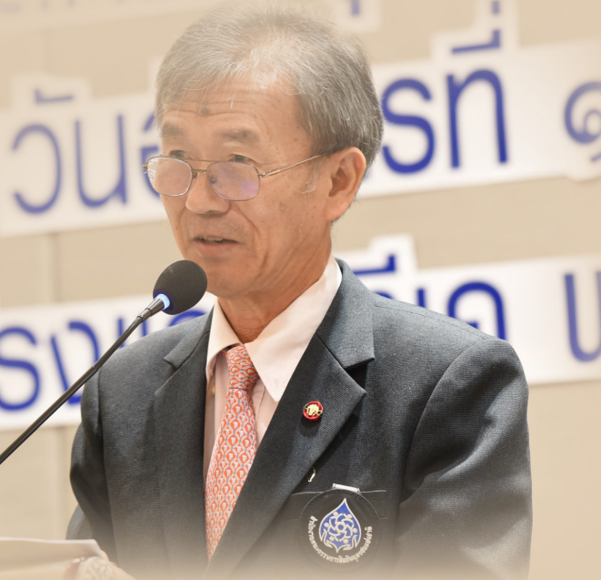
นายวัส ติงสมิตร ประธานกรรมการสิทธิมนุษยชนแห่งชาติ (อ่านต่อหน้า 2)

ระหว่างปี 2558 – 2563 (ข้อมูล ณ วันที่ 31 พฤษภาคม 2563) มีเรื่องร้องเรียนเข้าสู่การพิจารณา 2,731 เรื่อง ได้จัดทำรายงานผลการตรวจสอบการละเมิดสิทธิมนุษยชน รวมทั้งสิ้น 2,358 เรื่อง (คิดเป็นร้อยละ 86.34) โดยพบว่าภูมิภาคที่มีการร้องเรียนว่าเกิดเหตุการณ์การละเมิดสิทธิมนุษยชนมากที่สุด มักเป็นพื้นที่ชุมชนเมืองที่มีประชากรหนาแน่น คือ กรุงเทพมหานคร ภูมิภาคที่มีการเกิดเหตุการณ์ละเมิดลำดับรองลงมาคือ ภาคใต้ และภาคตะวันออกเฉียงเหนือ ส่วนประเภทสิทธิที่มีการร้องเรียนมากที่สุด คือ สิทธิในกระบวนการยุติธรรม จำนวน 1,057 เรื่อง จากจำนวนเรื่องที่ร้องเรียนเข้ามาทั้งหมด 2,731 เรื่อง คิดเป็นร้อยละ 38.7 ส่วนใหญ่เป็นเรื่องที่เกี่ยวข้องกับการกระทำของเจ้าหน้าที่ของรัฐ ในประเด็นสิทธิของผู้ต้องขัง เช่น การให้ได้รับการพิจารณาคดีด้วยความรวดเร็ว การถูกทำร้ายในระหว่างการจับกุม การซ้อมทรมาน เป็นต้น