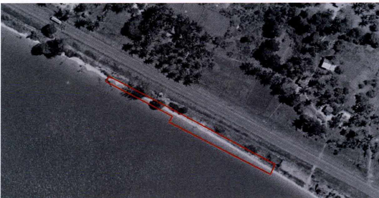
ภาพที่ ๒ ภาพถ่ายทางอากาศซึ่งถ่ายตามโครงการ น.ส. ๓ ก. เมื่อปี ๒๕๑๘