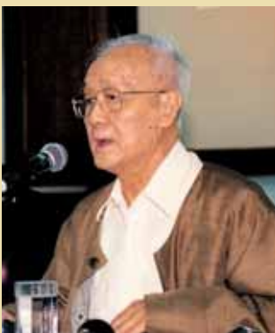
ศ.เสนห์ จามริก ประธานกรรมการสิทธิมนุษยชนแห่งชาติ

“คำถามของผม คือ ถ้าเราไม่รักษาความศักดิ์สิทธิ์ของบทมาตราต่างๆ เหล่านี้ไว้ เรากำลังจะเดินก้าวหน้าหรือถอยหลังกลับไปสู่เผด็จการในอดีต?” 🇹🇹