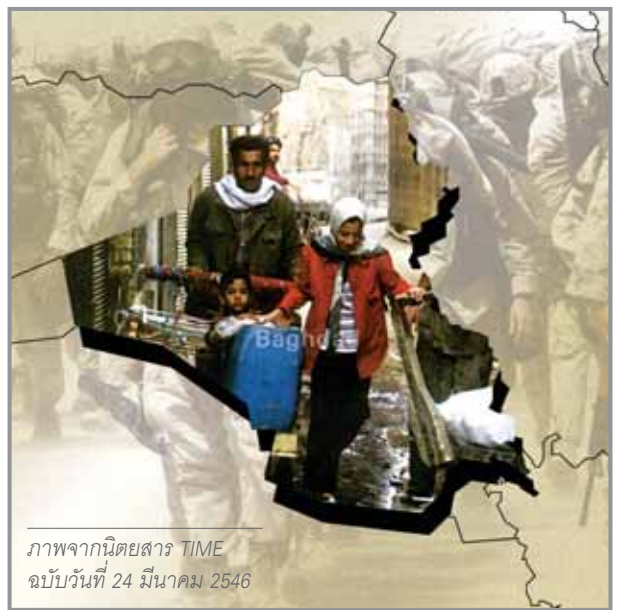
ภาพจากนิตยสาร TIME ฉบับวันที่ 24 มีนาคม 2546

ผลของการประกาศสงครามครั้งนี้ จึงถือได้ว่ากระบวนการสร้างสันติภาพ รวมถึงกระบวนการยุติธรรมระหว่างประเทศที่ใช้ในการขจัดปัญหาข้อขัดแย้งในระดับโลกนั้นได้ถูกทำลายลงไปแล้ว และจากนี้ต่อไปทุกๆ ประเทศคงอยู่ในภาวะหวาดผวาว่าเมื่อใดที่ประเทศตนเองมีความขัดแย้งกับชาติมหาอำนาจก็อาจจะถูกจัดการด้วย “ศาลเตี้ย” เพราะเป็นวิธีที่ผู้มีกำลังแข็งแกร่งกว่าเป็นผู้กำหนดวิธีการ และผลได้ตามใจชอบ ซึ่งถือได้ว่าเป็นการถอยหลังเข้าคลองของกระบวนการสันติภาพ และกระบวนการยุติธรรมโลก