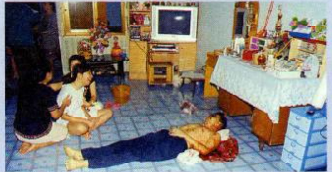
ภาพผู้ถูกยิงเสียชีวิต ซึ่งเจ้าหน้าที่ตำรวจ จ. อุตรดิตถ์ ระบุว่าผู้ตายเกี่ยวข้องกับยาเสพติด แต่ญาติยืนยันว่าผู้ตายมิได้เกี่ยวข้องกับยาเสพติด

3. รัฐบาลควรให้หน่วยงานอื่นๆ เข้าไปตรวจสอบอย่างละเอียดถี่ถ้วนและแยกแยะ เพื่อให้สังคมไทยทั่วไปยอมรับการปฏิบัติงานของเจ้าหน้าที่ตำรวจ กรณีสำนวนคดีเดิมเจ้าหน้าที่ตำรวจได้ระบุไว้ว่าผู้ตายเกี่ยวข้องกับยาเสพติด เพื่อคงไว้ซึ่งหลักความยุติธรรมให้คำร้องอยู่ในสังคมไทยต่อไป