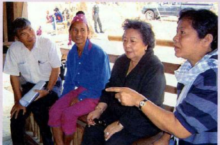
อนุกรรมการชาติพันธุ์พบกับผู้นำชุมชนกุยตะ

การเกิดขึ้นของนิคมคนภูเขาในป่าเต็งรังที่ถูกอพยพมาอยู่ที่บ้านวังใหม่(บ้านผาซ้อ) ตำบลร่องเคาะ อำเภอวังเหนือ จังหวัดลำปาง ที่มีการอพยพชาวบ้านออกจากเขตอุทยานแห่งชาติดอยหลวงเพื่อฟื้นคืนความอุดมสมบูรณ์ และดูเหมือนว่าชาวบ้านจะมีชีวิตความเป็นอยู่ที่ดีขึ้น เนื่องจากมีปัจจัยพื้นฐานเพื่อการดำเนินชีวิต สาธารณูปโภคและบริการขั้นพื้นฐานต่างๆ แต่ในทางกลับกันชาวบ้านกลับเผชิญกับความลำบากยากจน ต้องส่งลูกหลานไปทำงานในเมือง การค้าบริการทางเพศ และบางคนก็เข้าสู่ขบวนการค้ายาเสพติด