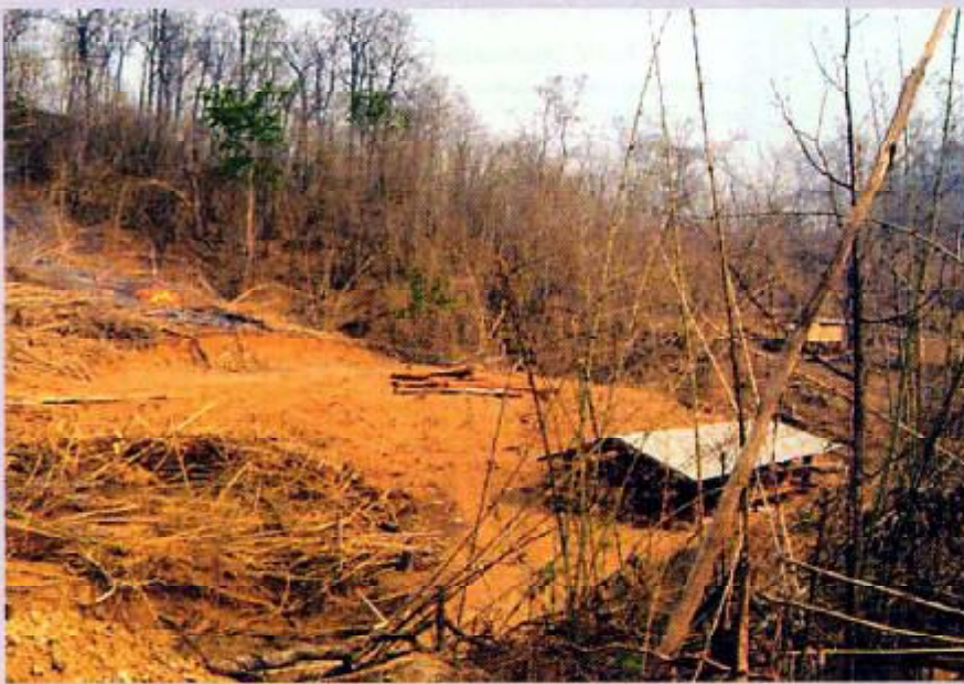
สภาพพื้นที่หมู่บ้านพาซ้อ

การวิพากษ์แผนแม่บทการพัฒนาบนพื้นที่สูง กับสิทธิมนุษยชนของ กลุ่มชาติพันธุ์