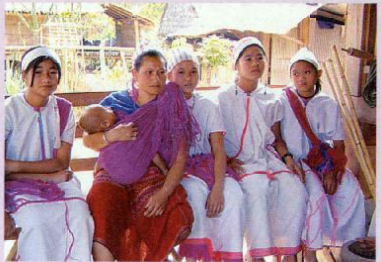
เด็กและผู้ใหญ่ที่ชุมชนกุยตะ

ปรากฏการณ์ "การรวมกลุ่มหยุดทำกิน และประท้วงชีวิตแบบเท่าที่หาได้" ของชาวกะเหรี่ยงบ้านกุยตะ ตำบลแม่จัน อำเภออุ้มผาง จังหวัดตาก จำนวน ๑๖ ครอบครัว ๙๘ คน เนื่องมาจากการถูกปฏิเสธวิถี "การทำไร่หมุนเวียน" ซึ่งปฏิบัติสืบต่อกันมาตั้งแต่บรรพบุรุษ ทำให้กะเหรี่ยงกลุ่มนี้ระลึกถึงอดีต (Nostalgia) เมื่อครั้งที่ "กินน้ำต้องรักษาป่า และกินป่าต้องรักษาป่า" โดยอธิบายผ่านพฤติกรรมและลัทธิความเชื่อต่างๆ