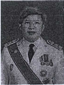
๕. นางสาวรีนวดี สุวรรณมงคล อดีตอธิบดีกรมคุมประพฤติ และอดีตอธิบดีกรมบังคับคดี